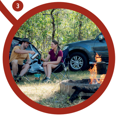
3 Nel Parco Nazionale del Kakadu sono a disposizione molte aree campeggio.